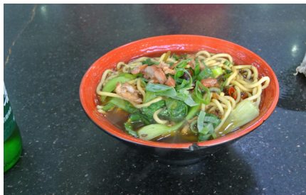
▲上 徐州駅の前で食べた麺料理。しっかりした味がついていた