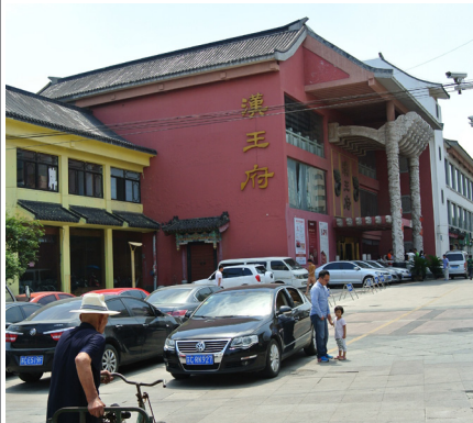
▲上 宮殿のような威容の漢王府。